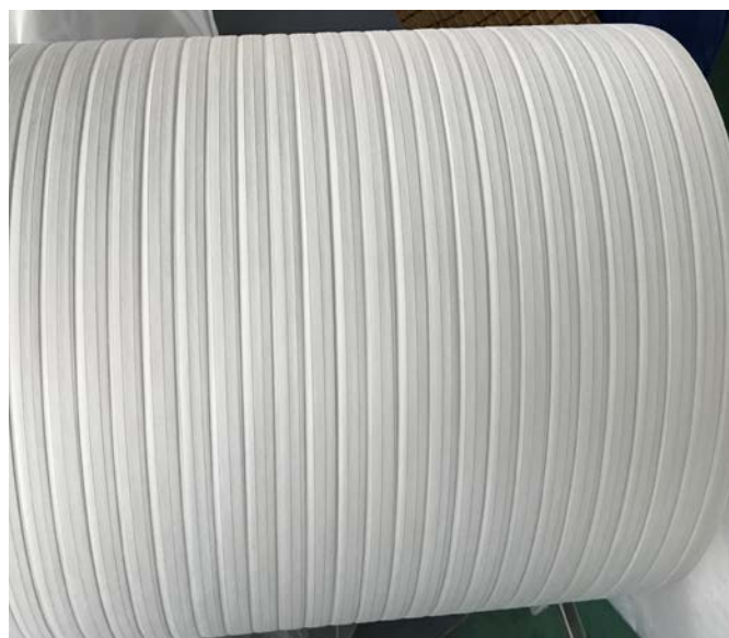
光ファイバー用不織布、吸水テープ等