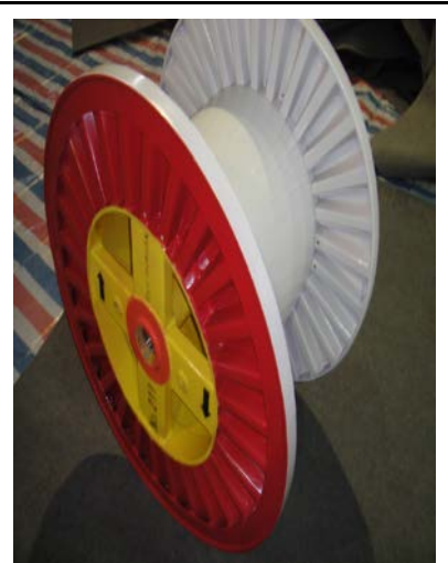
各类大小各种材质的塑料线盘，金属线盘