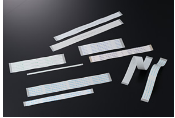
扁平化组件产品（FFC）是电子仪器、汽车、电视等上使用的布线材料。