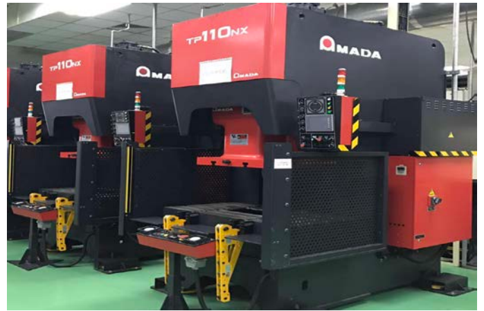
各种新设备的导入以及二手设备的买卖