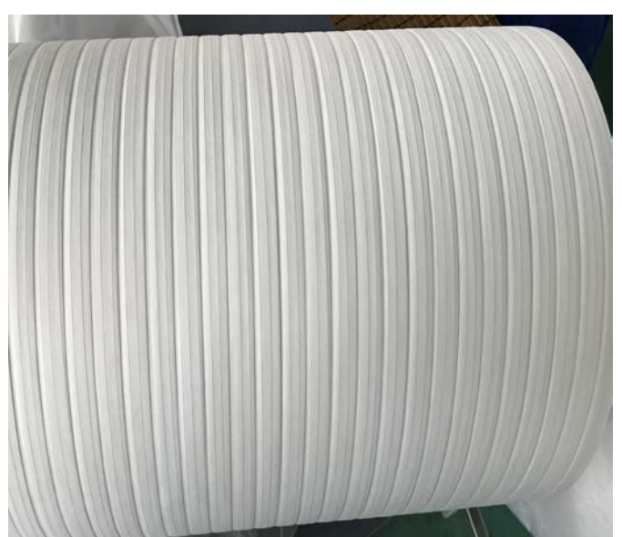
光缆用无纺布，阻水带