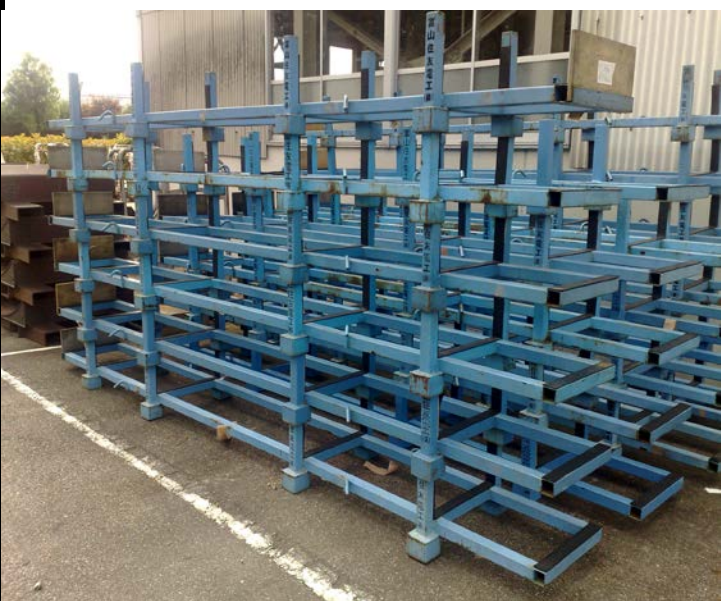
各类铁架托架制品