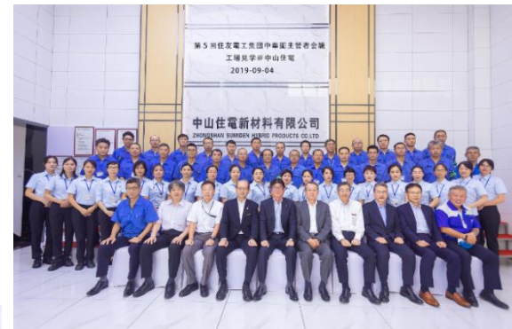
住友电工主管者会议合影