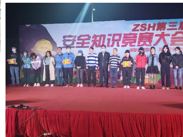
公司一年一度的全员安全知识竞赛