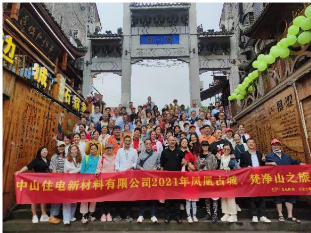
凤凰古城旅游合影