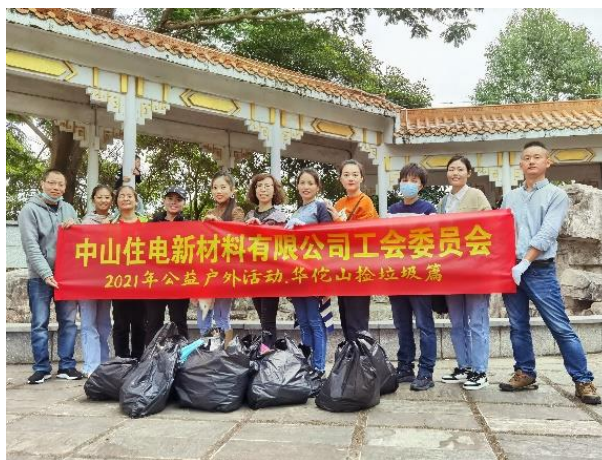
公司工会公益活动