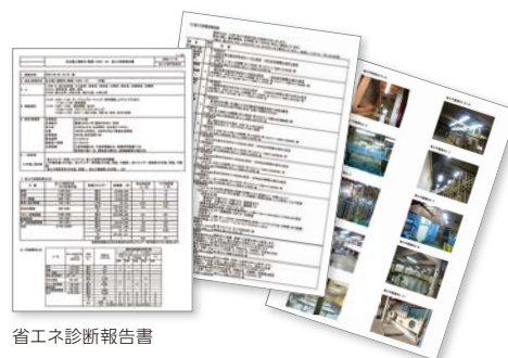
省エネ診断報告書

省エネ診断活動とは「省エネテーマ積み上げ4%削減」を合言葉に、生産条件の変更、品質対策・生産性向上、故障低減などの観点でテーマを取り上げ、主要拠点を巡回して、省エネ活動を掘り下げる活動です。各部門と生産技術本部が一体となって活動しています。今回のレポートでは、さまざまな製品群を生産している中国の3社を訪問し、現地では着実に展開されている省エネ活動の様子をご紹介します。