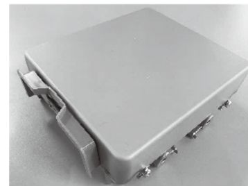
写真1 統合バックアップ電源外観