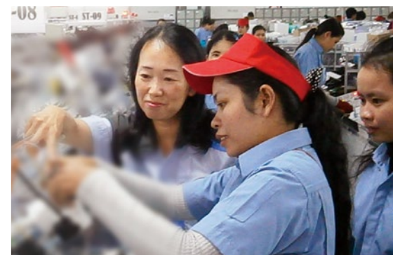
カンボジアでの指導風景

ちょうどルーマニアから帰国した頃、主任へ昇格しました。それは私にとって嬉しいキャリアパスではありませんでした。というのも、自分には主任のミッションを果たせる自信がなかったからです。実際、主任の仕事はそれまでの業務とは大きく異なるものでした。技能や作業の改善向上の取り組みだけではなく、5 つの製造ラインの責任者として、人やコストの「管理」、つまり工場運営のマネジメントを求められたのです。困難で辛い時間が続いたものの、「新たな挑戦」と考え直し、主任補佐と協力しながら工場管理の手法を習得し、自分なりのやり方を実践していきました。気付いたのは、どんな立場になっても基本は変わらないということ。それは対話を通じて相