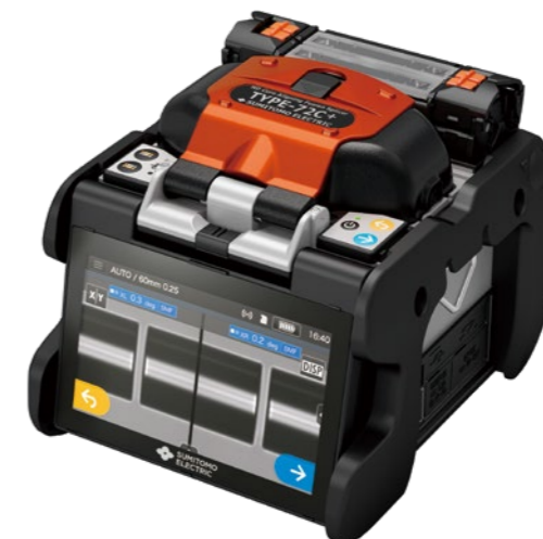
2020年10月に販売開始となった、最新のコア直視型光ファイバ融着接続機「TYPE-72C+」

「TYPE-71C」は融着接続機の世界に画期的なインパクトをもたらした。たとえば融着条件の自動判定は 2000 年代後半に宅内配線を目的とした曲げ特性強化光ファイバが普及、融着接続機にも適用が求められたことに端を発する。SMF とは異なる融着接続条件が必要となり、作業者は融着接続する光ファイバの種類ごとに接続条件を変更する必要があった。設定を誤ると接続損失の増加など品質の不具合が発生したのだ。これを解決するため本間や高柳らは、高倍率、高精細な観察方式を追求し、取得した光ファイバ像を画像処理