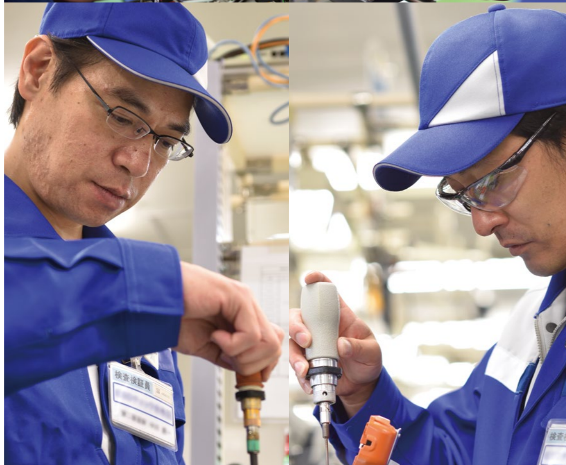
一つひとつ、熟練の手を介して 組み立てられていく

軽量化、世界の環境対応のための防滴・防塵性能の強化、タッチパネル初搭載などユーザーフレンドリーの追求、インターネットを介した融着接続機診断等々、すべてが新しい挑戦でした。どうすればユーザーに使いこなしていただけるか。融着性能自体に大きな差別化ができない中、徹底して基本性能の高度化とユーザーインターフェースにこだわって生まれたのが TYPE-71C です」(高柳)