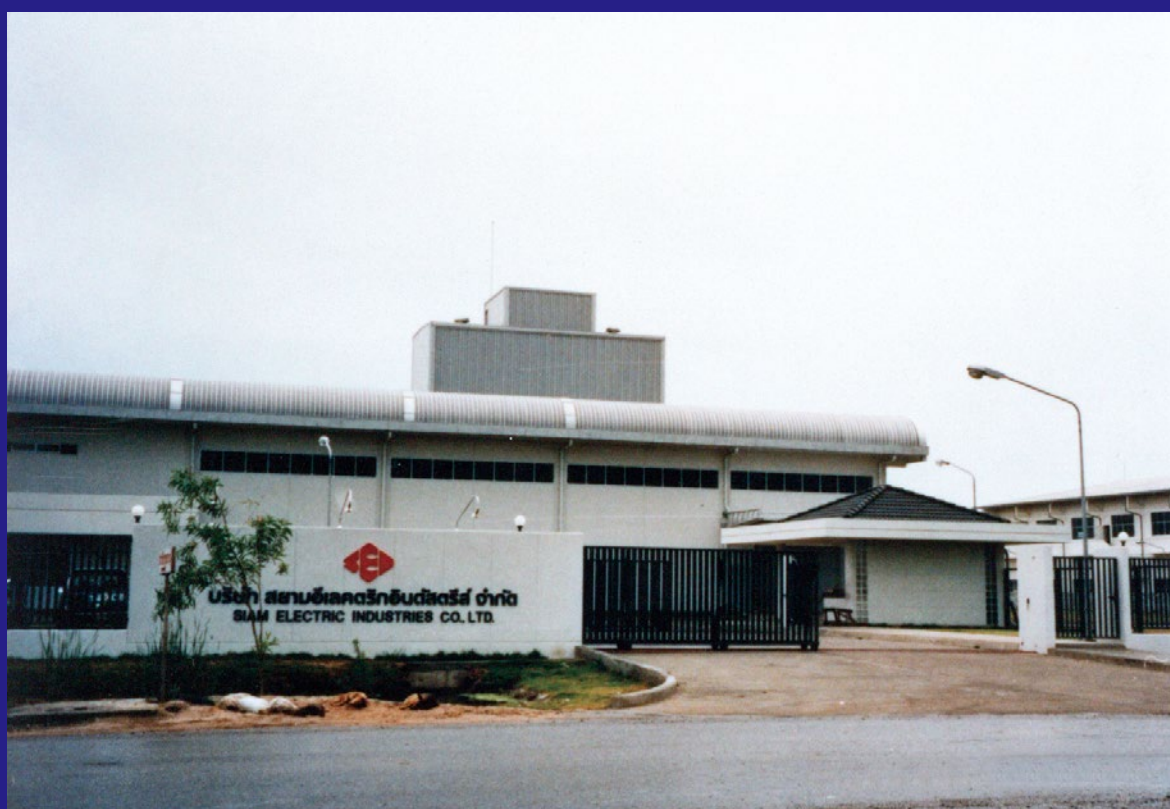
Siam Electric Industries Co., Ltd.

Siam Electric Industries Co., Ltd. (巻線製造会社) を設立