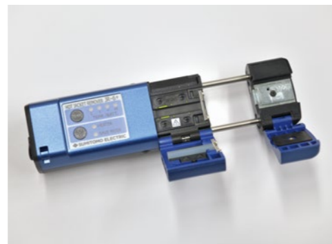
多心光ファイバの被覆除去に使用するジャケットリムーバ [JR-6+]