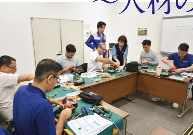
英国、中国、インド、シンガポール などから集まったスタッフへの 保守トレーニング風景。その 眼差しは真剣だ

増大する データライフックを繋ぐ 光ファイバ融着接続機。 グローバルリーダーへの道