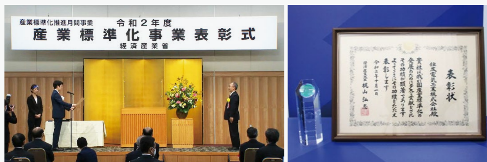
表彰式の様子(左)と贈呈いただいた賞状(右)

工業標準化法が施行された1949年以前から、当社は電線の品質、寸法、試験方法などに関する取り決めの制定(標準化)に携わってきました。以来、送配電ケーブル、産業用電線、架空電気導体、フロー電池システムな