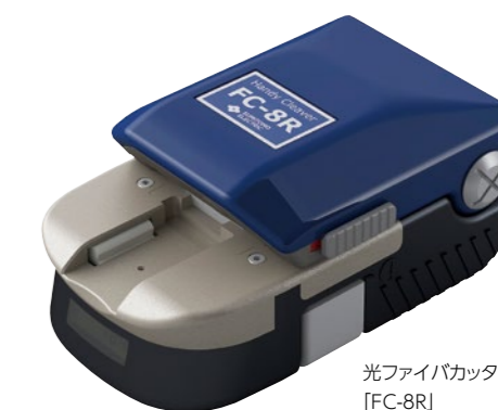
光ファイバカッター [FC-8R]

住友電工グループの開発陣が生み出した技術が、光ファイバのコア部を顕微鏡により観察し自動調心する「コア直視技術」だった。1984 年に販売を開始した融着接続機 (TYPE-33) において、高精度・高倍率の対物レンズを搭載した顕微鏡により、光ファイバのコア部を直視・観察して調心する技術を開発。さらに TYPE-34 では撮像方式に CCD カメラを採用した。これにより光ファイバのコア部の観