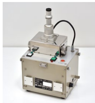
第1号の融着接続機 [TYPE-3]

こうした一連の融着接続機の開発は、1980～90 年代は、通信キャリアも入って同業他社と共同開発を行うことが多かった。本格的な開発競争のフェーズに入るのは 2000 年に入ってからであり、そこから住友電工グループの独自の技術が融着接続機の進化を牽引していくことになる。