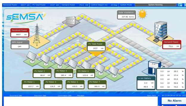
図3 グラフィカルユーザーインターフェースのイメージ

これまでのsEMSA®製品開発で構築した開発プラットフォームを活用し、需要家の実使用を想定した、最適な監視制御システムを短納期かつ低コストで実現します。具体的には、発電抑制量(推定)の表示、秒単位での収集データ表示、通信・計測の統合監視、カレンダー機能を有する運転スケジュール、発電電力の帳票出力が可能となります。また、グローバル対応(時差、英語表示)も標準機能としてサポートします。